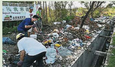
不負責任者把垃圾丟在空地，日積月累下，空地變成一個非法垃圾場。