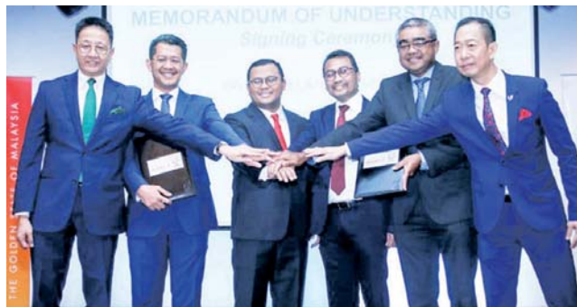
Amirudin (tiga, kiri) menyaksikan MoU dimeterai antara Invest Selangor Berhad (Invest Selangor) dan UMW Development Sdn Bhd (UMW Development)

Menteri Besar Selangor, Amirudin Shari berkata, Lapangan Terbang Subang (Lapangan Terbang Sultan Abdul Aziz Shah) mewujudkan sebuah sistem