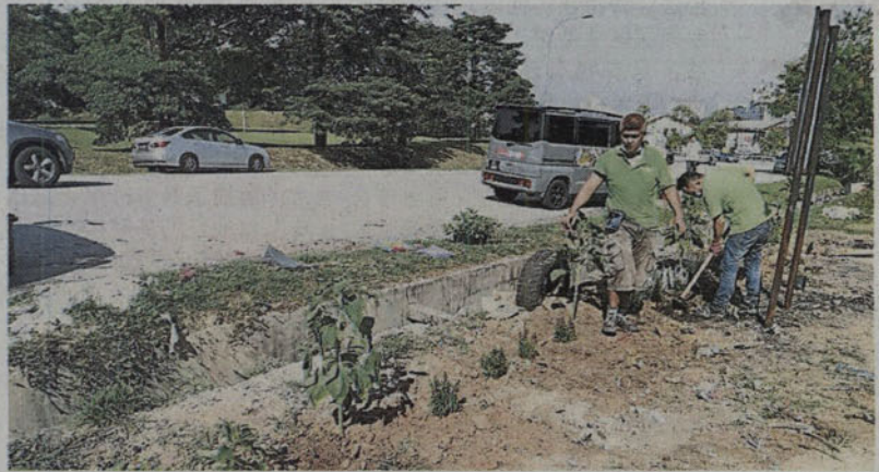
■清理非法垃圾场后，一起种植太阳花。