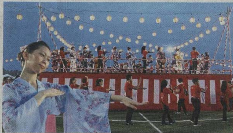
The Bon Odori Festival is a good opportunity for Malaysians and tourists to learn about Japanese culture.

This year, Tourism Selangor is planning to hold several major events and host numerous festivals and competitions including Selangor WorldChef Battlefield, Retromania Gathering, Kejohanan Bola Tampar Antarabangsa Piala Datuk Bandar, Wings of Kuala Kubu Baru, PJ Half Marathon, Inov8 Eco Trail Run and Klang Heritage Festival.