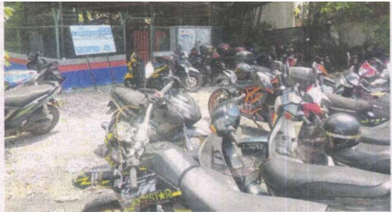
MOTOSIKAL yang diletakkan berhampiran pencawang elektrik boleh menghalang laluan jika berlaku kecemasan.