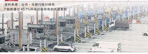
资料来源：公司、马银行投行研究 *包括通过 43.7% 环城控股持有的大道股权