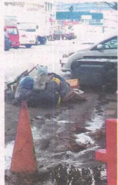
SIKAP segelintir peniaga membuang sampah di luar tong menyebabkan masalah pencemaran di Jalan 243, Seksyen 51A, Petaling Jaya, Selangor.