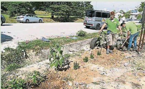
美化非法垃圾場，盼阻止垃圾虫亂丟垃圾。

Provided for client's internal research purposes only. May not be further copied, distributed, sold or published in any form without the prior consent of the copyright owner.