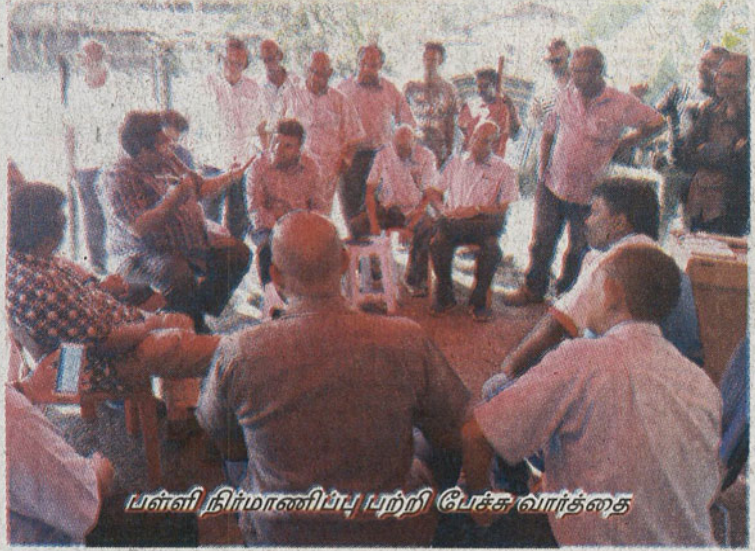
பள்ளி நிர்மாணிப்பு பற்றி பேச்சு வார்த்தை