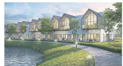
大马研究也谨慎看待金务大旗下的产业项目。